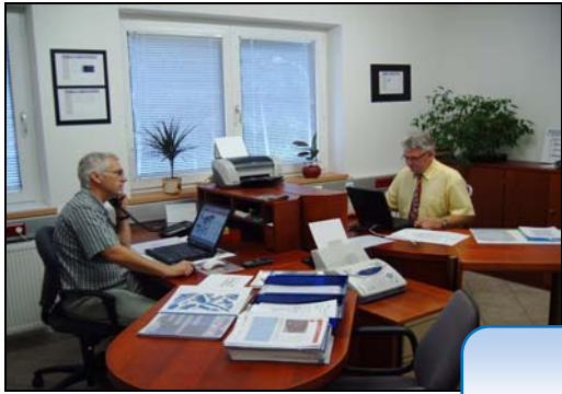
Verkauf und technische Beratung